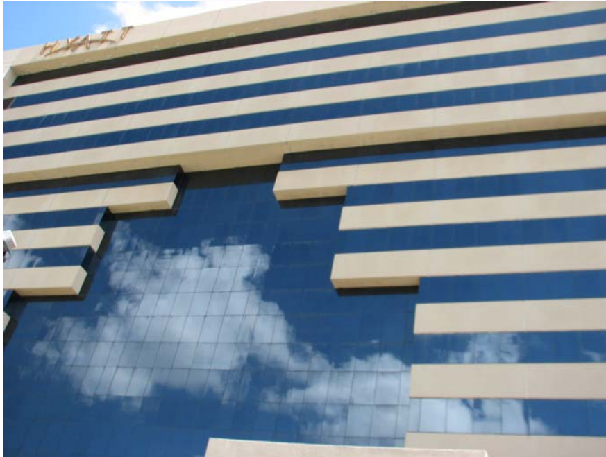
Fachada del Hotel Hyatt Regency Mérida

Fabricas de Hielo del Hotel Hyatt Regency Mérida, desde donde se surte hielo para sus diversos restaurantes y bares.