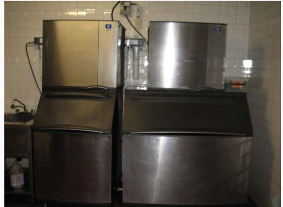
Fabricas de Hielos